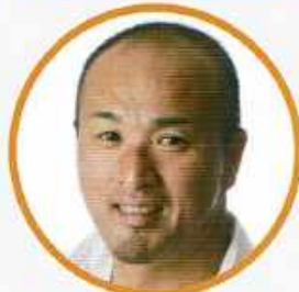
副島 正純選手 車いす陸上選手 アテネパラリンピック 銅メダリスト ほか